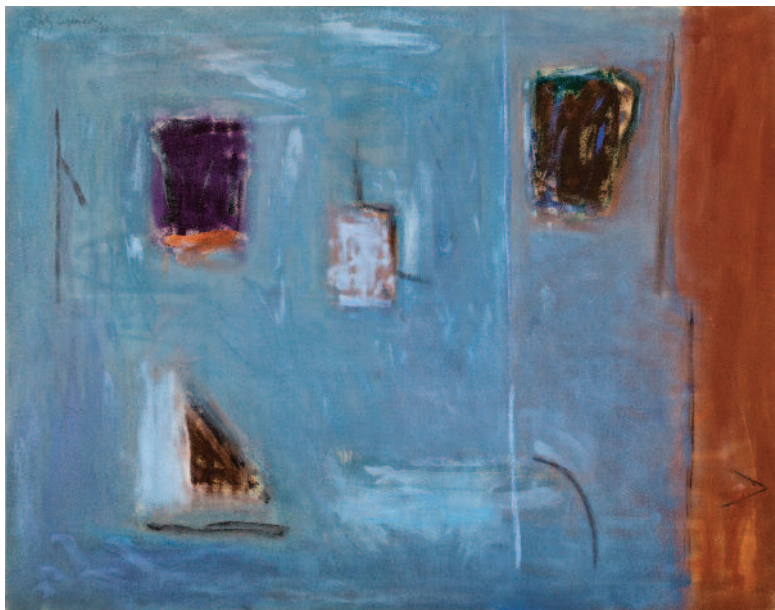
Musica aquatica , 1986 acrylique sur toile, 114 x 146 cm, © Galerie Joan Prats.