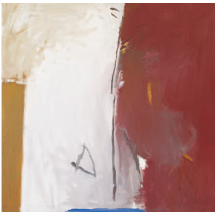
Eco (Écho) , 1985 acrylique sur toile, 150 x 150 cm.

Exposition du 7 juillet au 30 septembre 2018