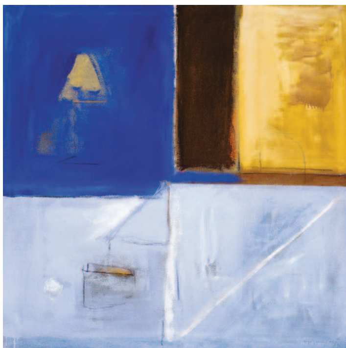
Estructura interior , 1996 acrylique sur toile, 150 x 150 cm, © Galerie Joan Prats.

« Ma peinture travaille plus sur une suggestion que sur la définition ou représentation concrète des choses. Je voudrais que dans mes peintures on respire la couleur comme je respire la couleur en regardant la mer. »